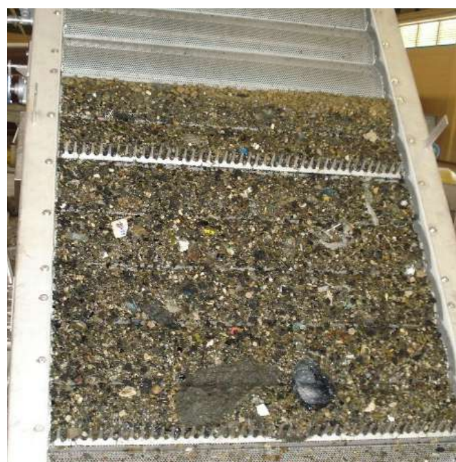
A MPS Meva suporta partículas pequenas e grandes