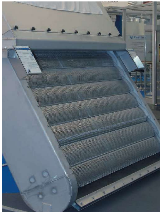
A MPS Meva é entregue com um painel contínuo