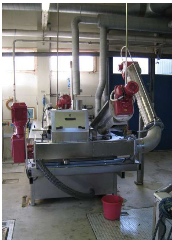
SRS Meva: Eficaz, Compacta, fechada