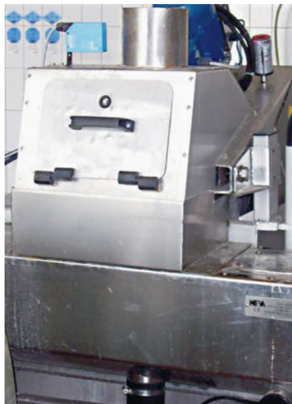
Nenhum problema de odor devido ao sistema fechado