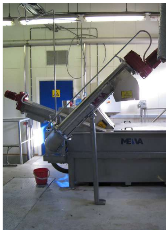
SRS Meva com parafuso transportador de areia. Peneira conectada à SWP e CPS.