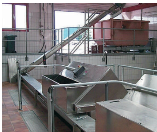
A alta acessibilidade garante uma fácil manutenção e controle visual da peneira