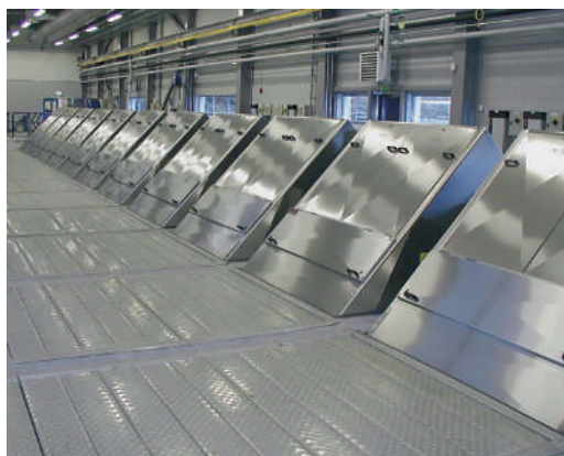
Meva Monoscreen em uma ETE

A Monoscreen Meva opera de forma intermitente. Assim, a operação pode ser ajustada para o fluxo de entrada. Um sensor de nível é instalado no canal da parte frontal da peneira. A peneira é ligada quando um nível predefinido de água é atingido e opera até que o nível de água esteja abaixo do valor predefinido. O ciclo é repetido quando o nível é alcançado novamente.