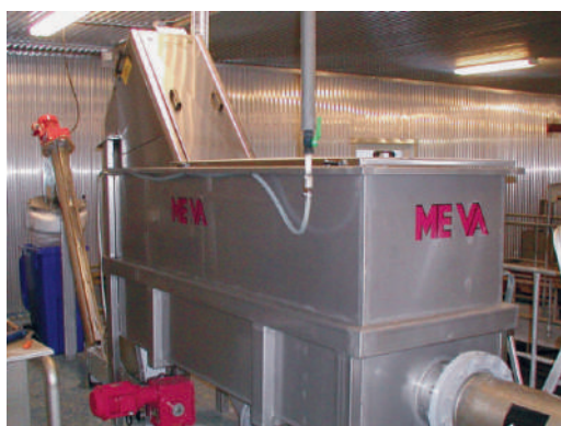
Meva Monoscreen em Combinação com uma Prensa Lavadora de parafuso